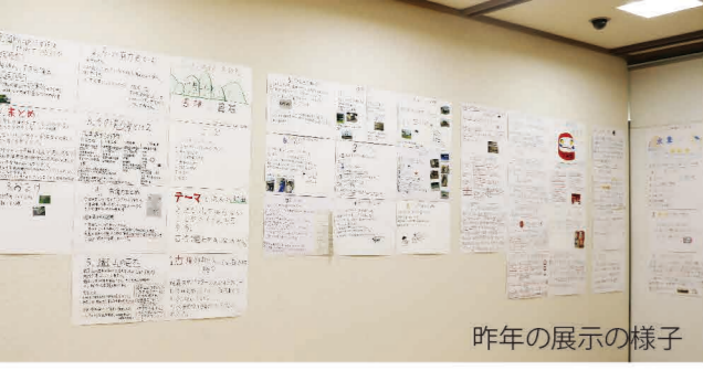
昨年の展示の様子