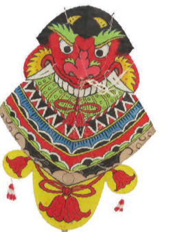
バラモン凧(長崎県)