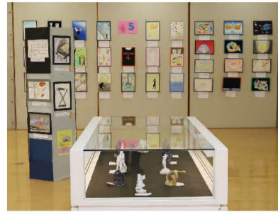
昨年の展示の様子

5・6年生が総合的な学習で取り組んだ「身近な水辺…山路川調査!」の成果を展示します。力作をぜひご覧ください。