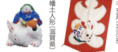
干支凧(北海道) 小幡土人形(滋賀県)