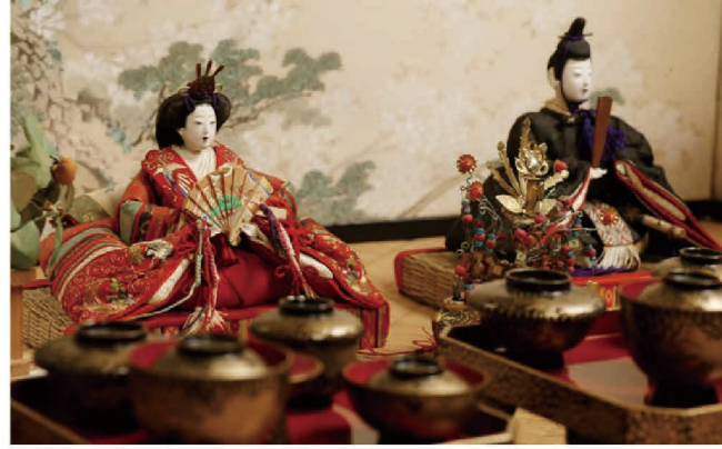
明治期のひな人形