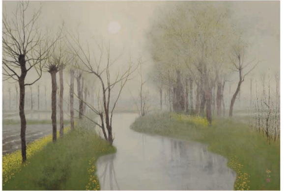
中路融人「朝霧の川」

江戸時代後期から明治・大正・昭和初期にかけてのひな人形や各地の郷土玩具のおひな様を一堂に展示します。