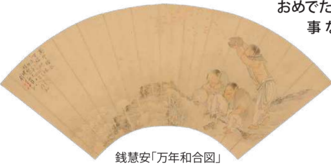
錢慧安『万年和合図』