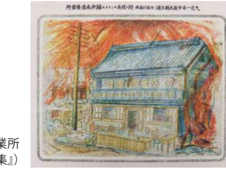
エジソンからの手紙 (1922年2月16日)