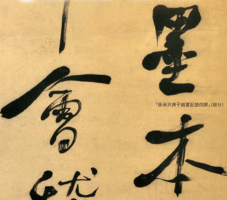
「孫承沢庚子銷夏記語四屏」(部分)